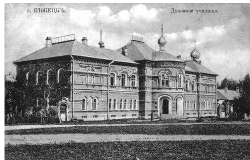
Бежецьке повітове духовне училище