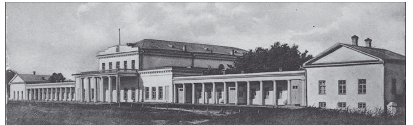
Дім Катеринославського дворянського депутатського зібрання, колишній палац Г. Потьомкіна. Катеринослав, листівка, 1912 р.

Із нобілітаційних документів цього архівосховища ми найкраще дослідили родовідні книги за 1798–1813 рр. Вони мають вигляд зшитого в один фоліант збірника зошитів із титульними листками, на яких зазначено, за який рік кожна з них. При цьому, науковці