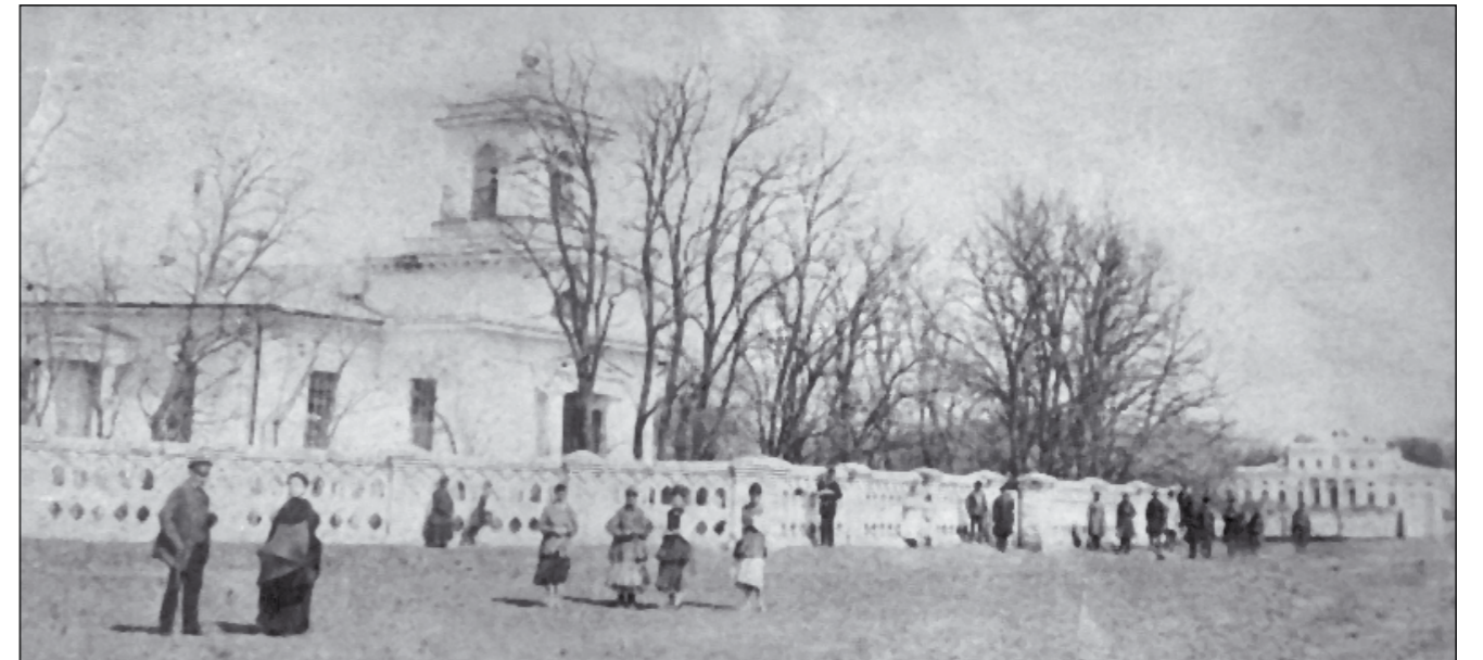
Архангело-Михайлівська церква та палац Миколи Родзянка у селі Попасне Новомосковського повіту. 1914 р.