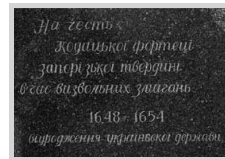
Меморіальний напис на стелі