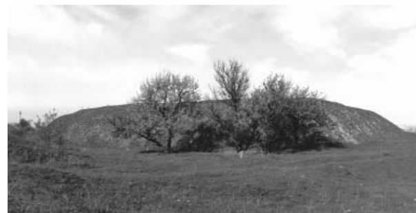
Залишки фортечного бастиону. Фото 2011 р.

На значній території навколо сучасного Дніпропетровська, від гирла Самари до гирла Сури, існували поселення, фортеці та укріплення, що виникли значно раніше, ніж колишній губернський центр Південної України місто Катеринослав: Стара Самарь, Богородицька (Новобогородицька) фортеця, Сергіївська (Новосергіївська) фортеця, Новий Кодак, Усть-Самарський ретраншемент, слобода Половиця тощо. Одним з таких поселень, розташованих неподалік від міста, є селище Старі Кодаки (Кайдаки). Тут у далекому минулому стояла відома колись фортеця, овіяна славою козацьких походів, воєн та повстань. Визначний історик козащини Д. І. Яворницький, оцінюючи її значення, писав: