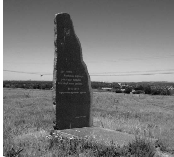
Стела на честь Кодацької фортеці при вїзді в село Старі Кодаки