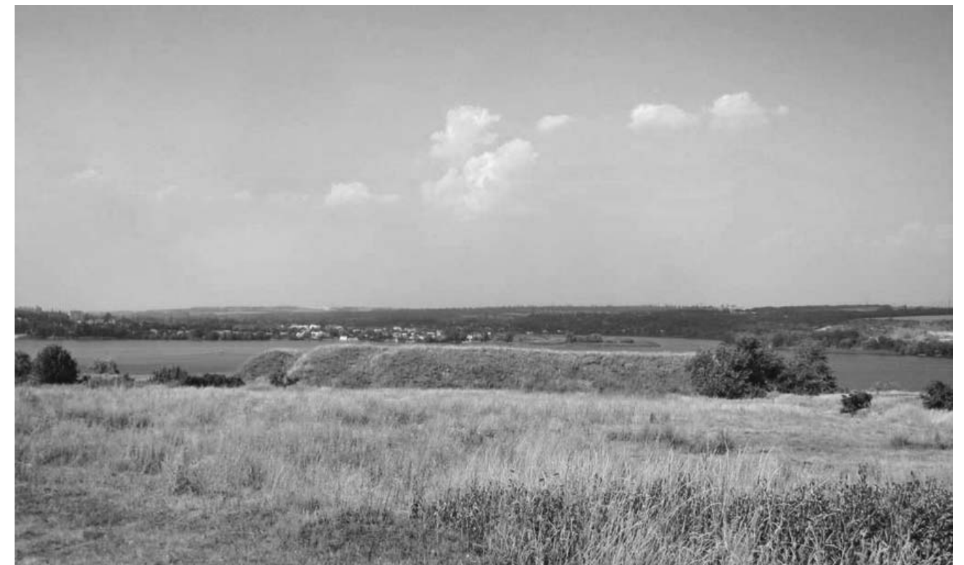
Залишки фортечних валів. Сучасне фото